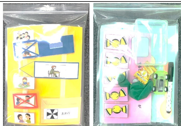
練習用教材セット表と裏面

開催方法として、パソコン又はタブレットとウェブ環境が整っている必要があります。開催日までに、右の 練習用教材セット を送ります。開催日の朝9:00頃からEメールで接続先のアドレスを送ります。それを開いて9:30頃から接続テストを行い、10:00から開催します。